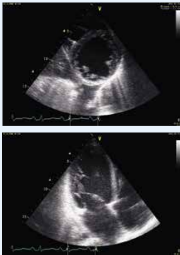
Kuva 1. Trabekuloiva kardiomyopatia nuorella potilaalla.

Oleellista on hematologisen perussairauden hyvä hoito. Tromboosiprofylaksiasta ei ole tutkimusnäyttöä ja joskus tromboembolisia tapahtumia ilmenee antikoagulaatiohoidosta huolimatta. Vasemman kammion etenevä